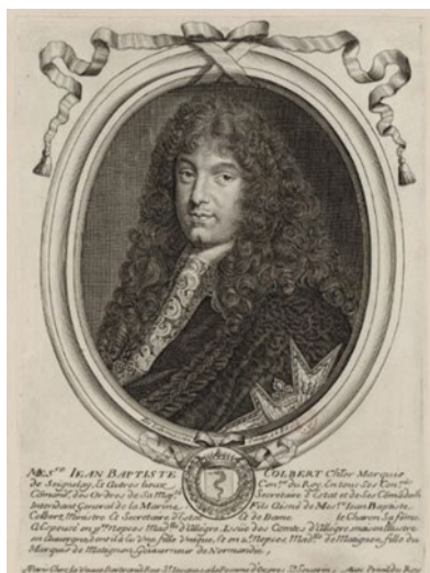
Jean-Baptiste Colbert, marquis de Seignelay Nicolas II de Larmessin, 1680